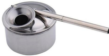
الشكل (3): المرذاذ

تم تطبيق خلطات الزجاج على النماذج الفخارية بواسطة المرذاذ شكل (3) .