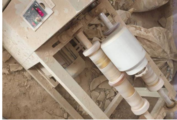
الشكل (2): طواحين بورسلينية (Ball mills)