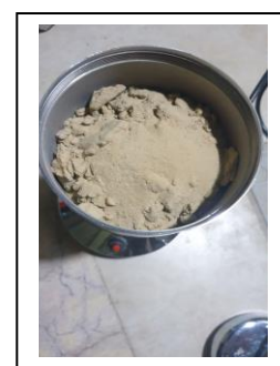
الشكل (1): طحن المواد